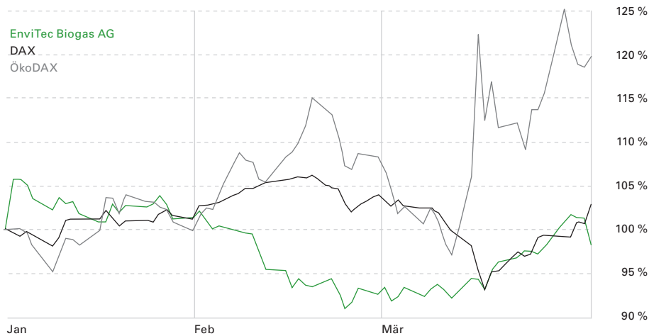
ENTWICKLUNG DER ENVITEC-AKTIE IM VERGLEICH